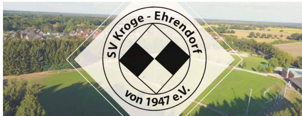
1. Strohballentriathlon in Kroge-Ehrendorf